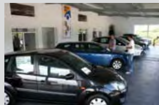
230m 2 Ausstellungsräume