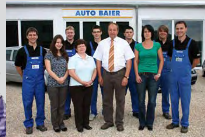
Das Team von AUTO BAIER