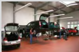
230m 2 Ausstellungsräume